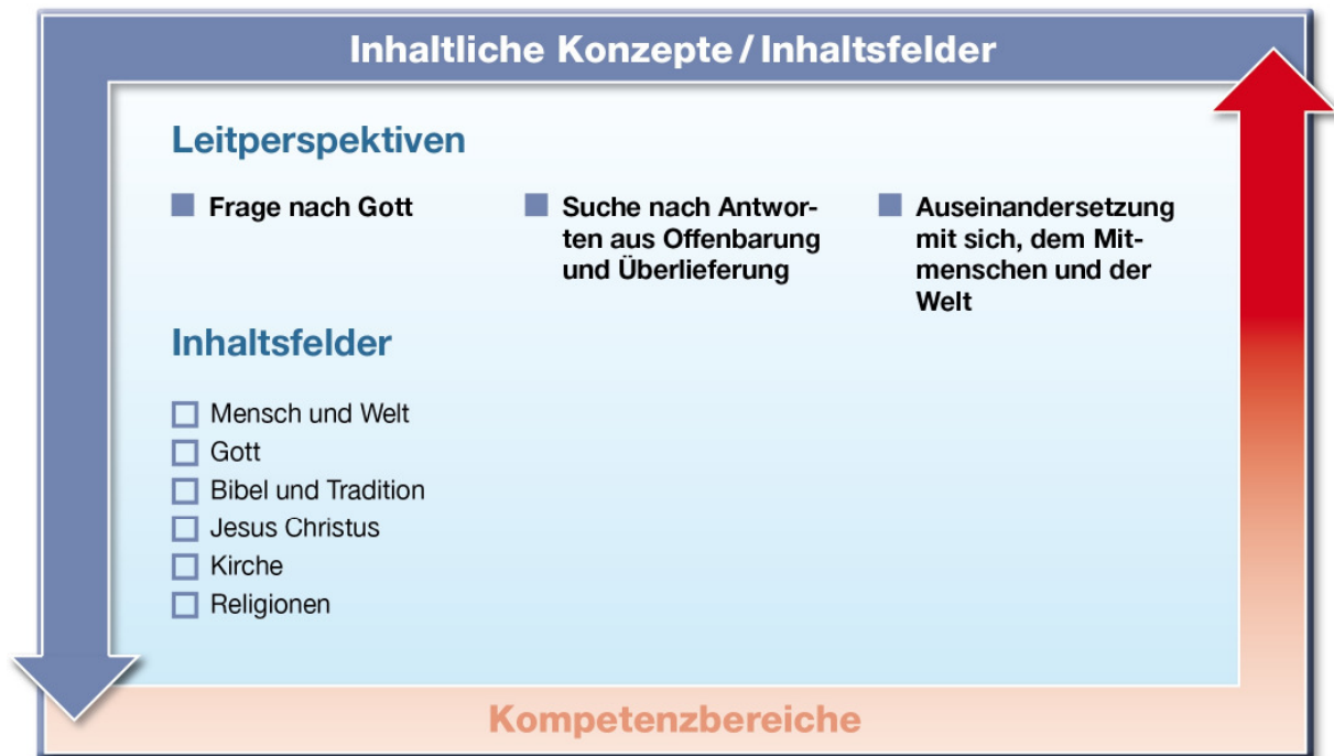
Abb. 2: Leitperspektiven und Inhaltsfelder im Fach Katholische Religion

Das inhaltliche Konzept des Faches Katholische Religion drückt sich in den Leitperspektiven „Frage nach Gott“, „Suche nach Antworten aus Offenbarung und Überlieferung“, „Auseinandersetzung mit sich, dem Mitmenschen und der Welt“ aus. Die Leitperspektiven erschließen sich in den sechs verbindlichen Inhaltsfeldern.